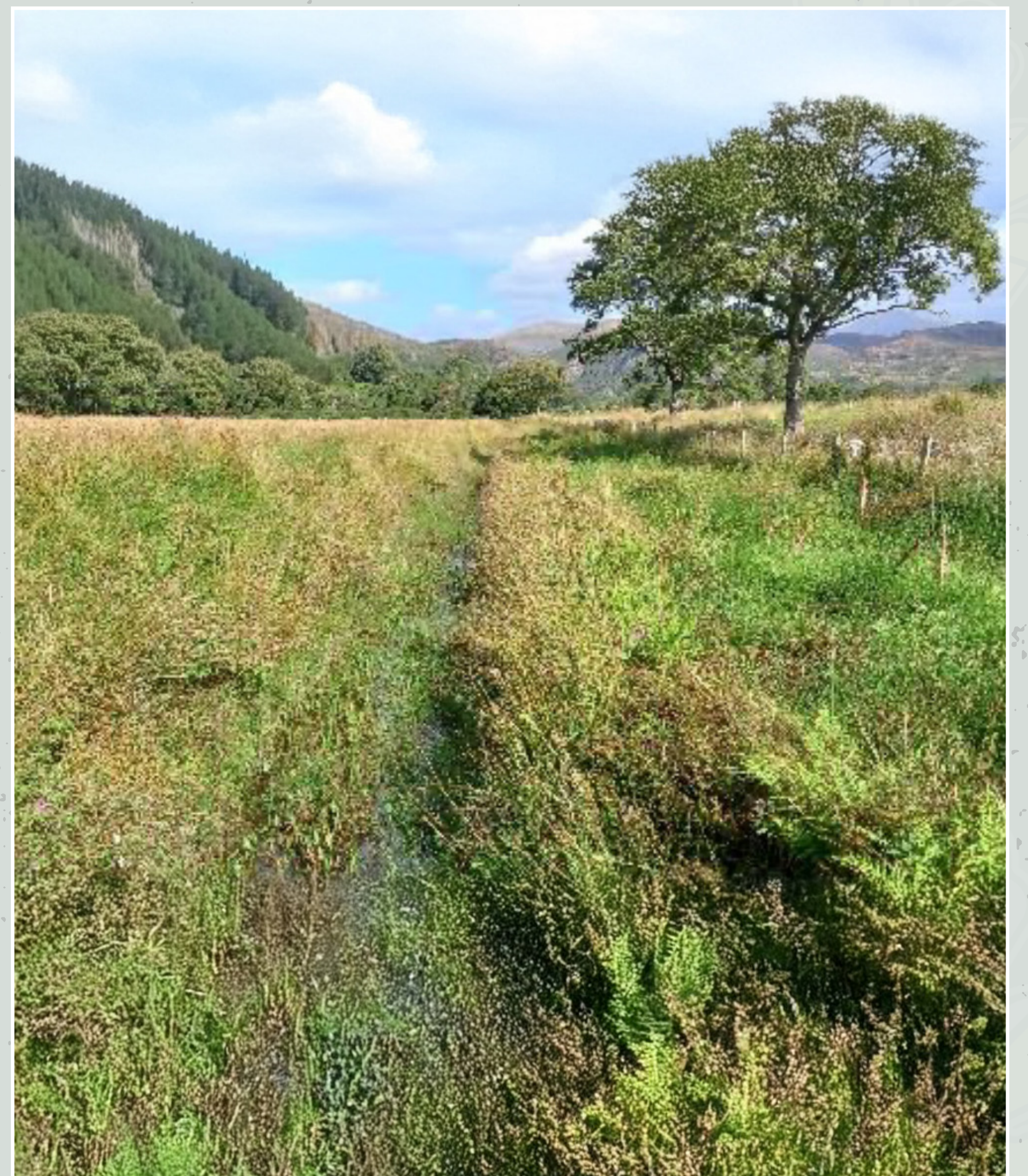
Ffigurau 2 a 3: Darn o ffos draenio fewnol o fewn un o'r plotiau pori torfol yn Hafod y Llyn, cyn (chwith) ac ar ôl (dde) dau gylchdro o bori torfol gyda 100 o ddefaid, 80 oen, a 16 o wartheg.