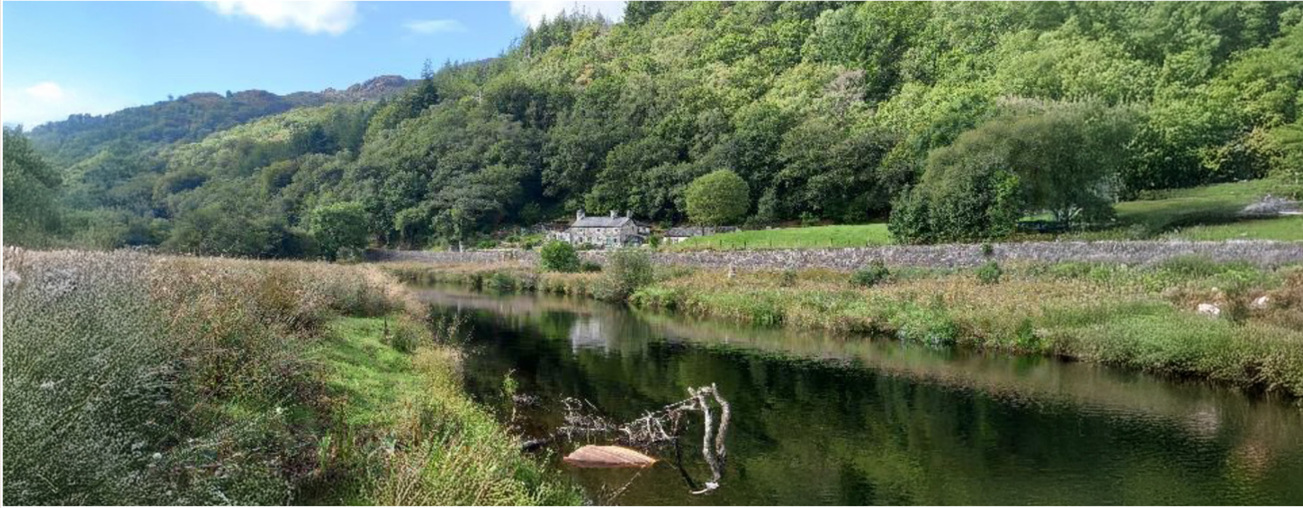
Ffigur 1: Golygfa o Afon Glaslyn, gyda Hafod y Llyn ar y chwith. Mae'r rhan hon o'r fferm yn cael ei phori drwy lawer o'r flwyddyn, gan arwain at laswellt heb Jac y Neidiwr yn ogystal ag unrhyw blanhigion blodeuol eraill ar wahân i laswellt a brwyn meddal ( Juncus effusus ). Ar draws yr afon mae darn ar wahân nad yw byth yn cael ei bori. Yno, cafodd Jac y Neidiwr ei strimio neu ei dynnu'n flynyddol rhwng 2019-2021. Heb gontract gwaith yn 2022, mae'r tir wedi cael ei ail-wladychu gan Jac y Neidiwr i'w gyflwr gwreiddiol cyn 2019 (wedi'i amlinellu mewn coch).

Mae defaid a gwartheg yn pori Jac y Neidiwr, yn enwedig pan fydd yn fach iawn ac yn gymysg â glaswelltau a pherlysiau y mae'r anifeiliaid wedi arfer â nhw. Fel hyn, o dan bori trwm, yn enwedig yn ystod dechrau'r tymor tyfu, mae'n bosibl atal Jac y Neidiwr yn llwyr. Mae'r broblem yn digwydd pan fydd y gyfraidd twf yn fwy na'r galw am bori, ac ar yr adeg honno mae symudiad i borthiant mwy cyfarwydd neu fwytadwy yn digwydd, gan adael i'r Jac y Neidiwr saethu i fyny. Am yr un rheswm, mae hefyd yn ymddangos nad yw da byw yn targedu Jac y Neidiwr os cânt eu rhoi mewn adran yn ddiweddarach yn y tymor pan fydd wedi tyfu'n dalach na'r porthiant cyfagos. Mae mynd i'r afael â hyn yn gofyn am niferoedd uchel iawn o dda byw, yn enwedig o wartheg, sydd bron yn amhosibl i'w ddarparu yn ystod misoedd y gaeaf.