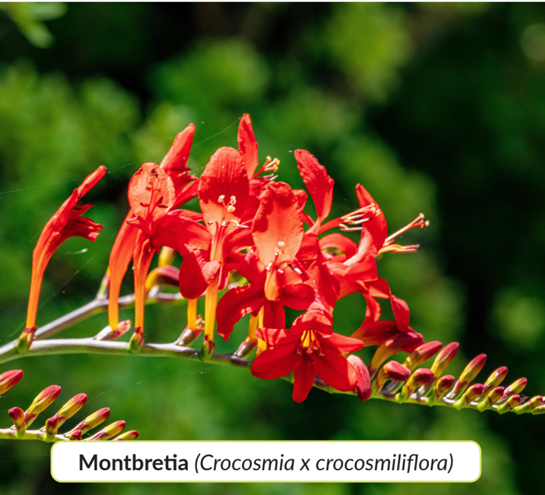
Montbretia ( Crocsmia x crocosmiliflora )