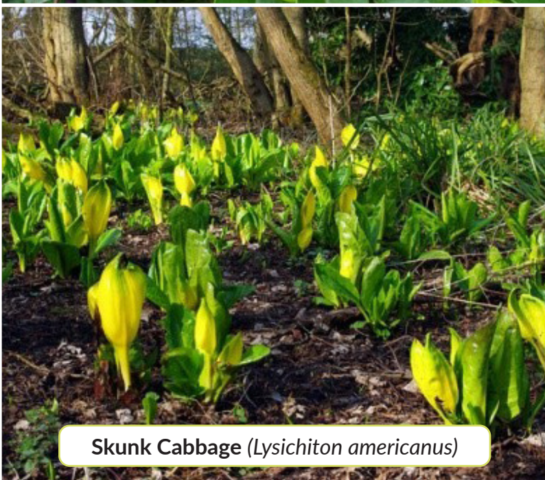
Skunk Cabbage ( Lysichiton americanus )