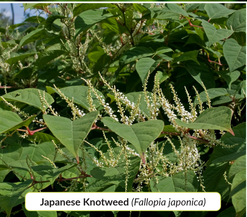
Japanese Knotweed ( Fallopia japonica )